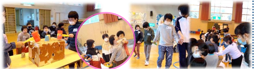
● 小学部では、初顔合わせの升形小交流で、嬉しい一日になりました。

小学部5・6年生の皆さんが、11月12日(金)に、升形小学校の皆さんと一緒に念願の交流学习を行い、エビカニダンスや輪取りゲーム、「とんとんずもう」などを楽しみました。素敵なイラスト付きのお手紙には、「また会えるのを楽しみにしています。」と、嬉しいメッセージもいっぱい！中学部は、11月17日(水)に日新中と第2回目のオンライン交流を行い、新養祭の動画を見ていただいたり、クイズを楽しんだり…と、Zoomの活用も有意義なチャレンジに！