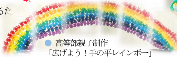
● 高等部親子制作 「広げよう！手の平レインボー」