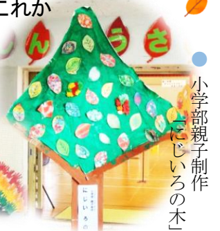
● 小学部親子制作 「こじじいの木」